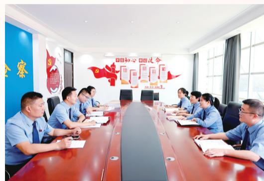
检察干警讨论案件。