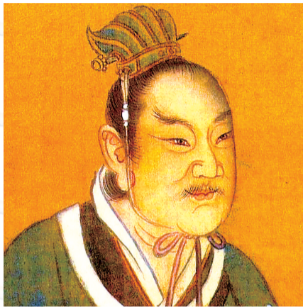
应劭像(项城市民间文学研究会提供)。

6月9日,本报3版报道《全国高考作文试题引用周口东汉大儒哲言》一经刊发,即引发社会各界广泛关注。这段源自东汉应劭的千年古训,不仅是高考考场上的思辨考题,更是中华文脉的生动回响。为探寻文本渊源、深挖先贤智慧、解析命题立意,记者专访多位专家学者,带领读者从古籍深处读懂古训真谛,在时代坐标中感悟守本固源的精神力量。