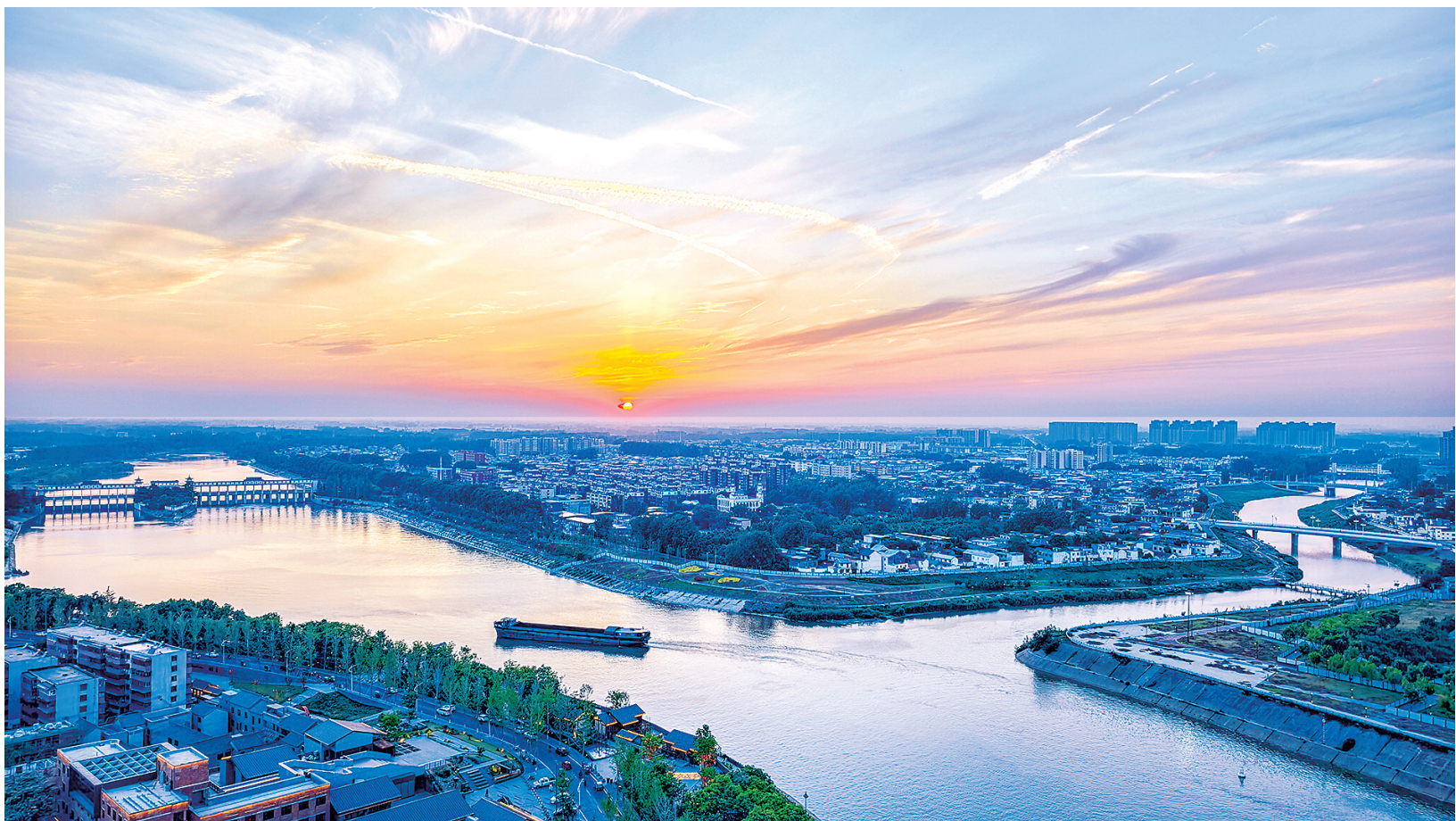
川汇区沙颍河畔,夕阳为天空晕染出暖橙与粉紫的渐变。大桥静静矗立,与穿城而过的沙颍河、贾鲁河汇流口相映成趣,见证着周口的岁月变迁。货船在波光中缓缓前行,两岸绿树成荫,城市建筑鳞次栉比,一幅生态与发展共生的画卷徐徐展开。

工业和信息化部科技司一级巡视员范斌表示,下一步将推动场景应用与安全协同,强化整机“身份证”在实际场景中的管理应用;推动标准体系与平台建设协同,加快制定全生命周期管理所需的标准;加强央地联动,部门协同,构建行业治理体系,共同提升系统化、精细化治理水平。(据新华社电)